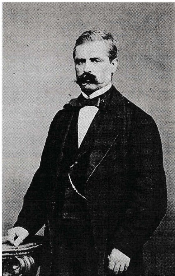
Francesco De sanctis

"un odore di ladri, che spaventa" e, alla luce di quanto sta accadendo la pratica del furto (ed il puzzo) sono ancora in essere. È questa una malattia nata con l'Italia.